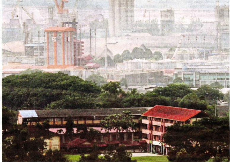
KEJADIAN terbaharu sesak nafas babitan empat sekolah.

Murid, guru sesak nafas akibat bau busuk hanya diberi rawatan pesakit luar