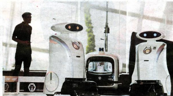
LAPANGAN Terbang Changi antara tempat yang menggunakan robot berkenaan.