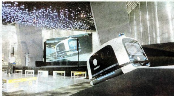
ROBOT membantu membersihkan kawasan.

Robot berkenaan sudah memulakan perkhidmatannya di kompleks beli-belah dan hiburan baru Lapangan Terbang Changi, sebuah galeri seni, pusat peranginan dan bangunan pejabat.