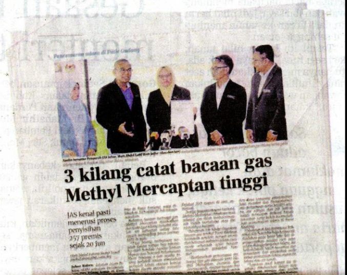
Keratan akhbar BH Jumaat lalu.

"Tindakan itu adalah bagi kesalahan mendirikan kilang di kawasan rizab tanah kerajaan. JAS juga akan mengambil tindakan mengikut Akta Kualiti Alam Sekeliling 1974," katanya.