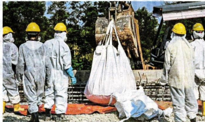
Emergency personnel cleaning up Sungai Kim Kim in March.

This led to the environmental pollution, which caused society